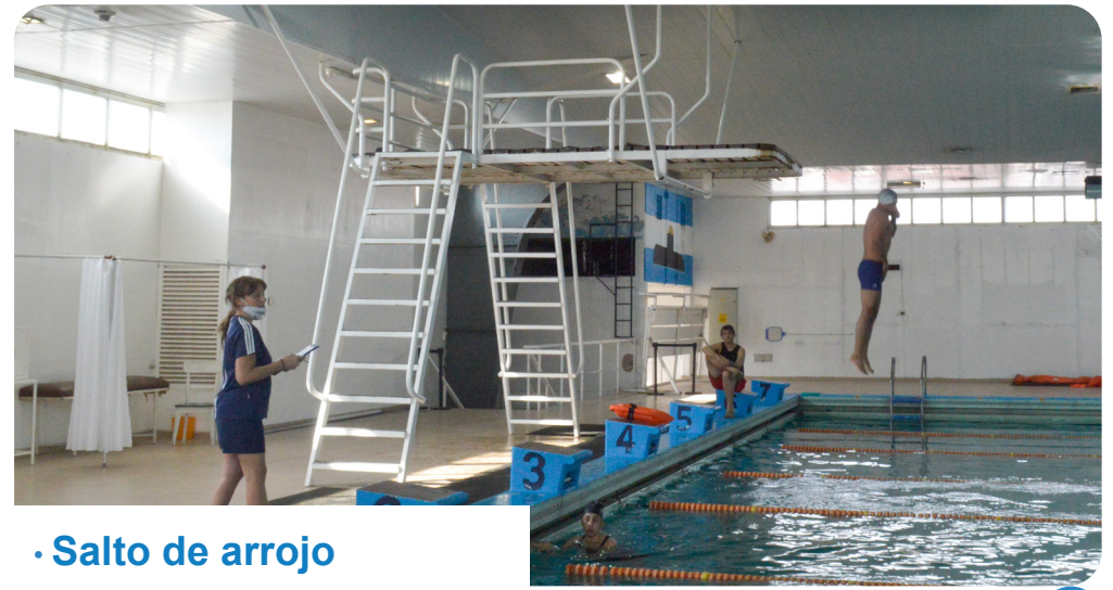
· Salto de arroj