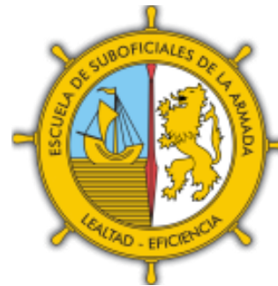
Escuela de Suboficiales