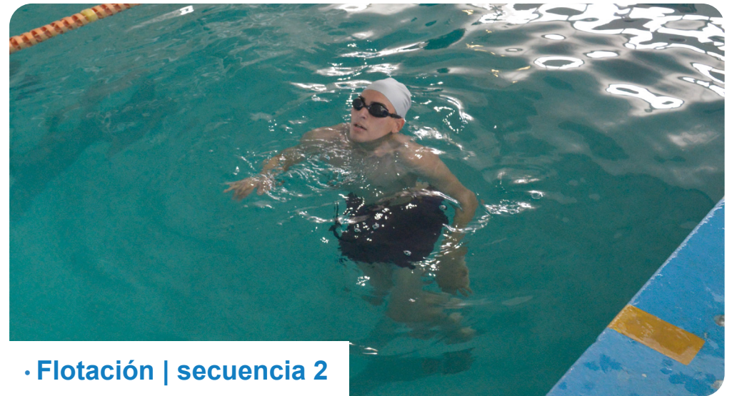
· Flotación | secuencia 2