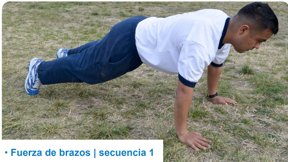
• Fuerza de brazos | secuencia 1