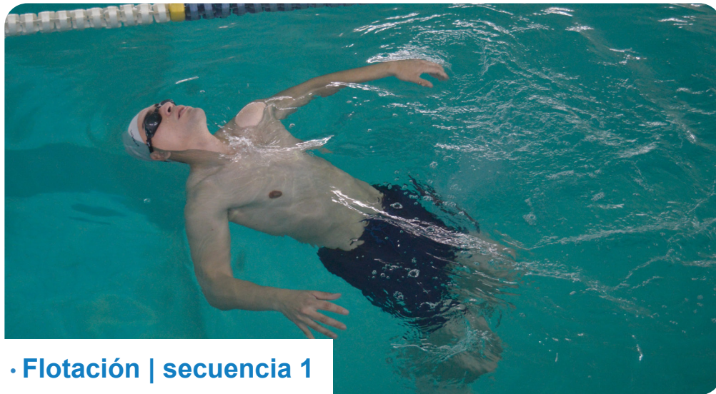
· Flotación | secuencia 1