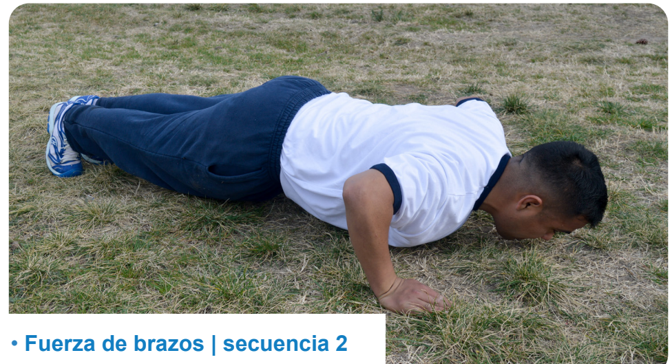
• Fuerza de brazos | secuencia 2