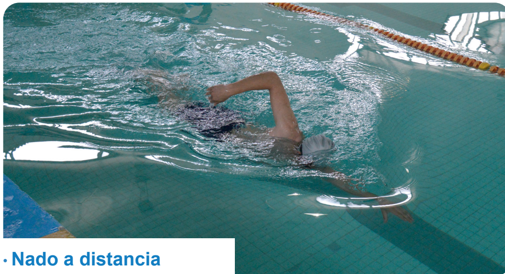
· Nado a distancia